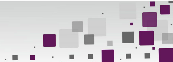
Figura 3 Caracterización de los textos trabajados según año, país, tipo de cooperativas estudiadas y existencia de una definición de gobernanza cooperativa