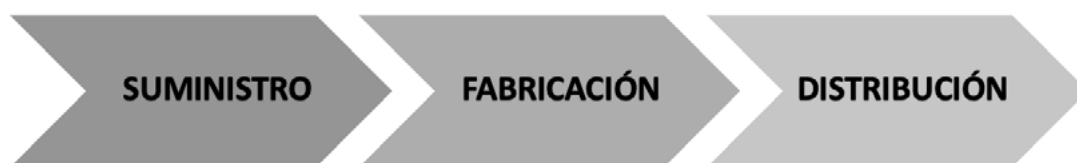
Figura 1 Fases Macro de la Cadena de Suministro

cerradas que esencialmente combinan la logística directa con logística inversa, es decir, estas cadenas de suministro cerradas pueden reducir sustancialmente la generación de residuos sólidos acorde a las perspectivas de distribuidores y sistemas de reciclaje (Lipan et al., 2017; Zhao et al., 2019); en otras palabras, satisfacer la demanda y, al mismo tiempo, recolectar y recuperar productos devueltos o usados (Alegoz et al., 2020) teniendo en cuenta que los seres humanos generan residuos en sus actividades diarias. En Ecuador se generan alrededor de 4 millones de toneladas por año, de las cuales se hacen esfuerzos para recuperar la mayor cantidad de residuos potencialmente reciclables, ya que una disposición final de dicha cantidad de residuos llevaría a un colapso de los rellenos sanitarios disponibles (Alarcón, 2017).