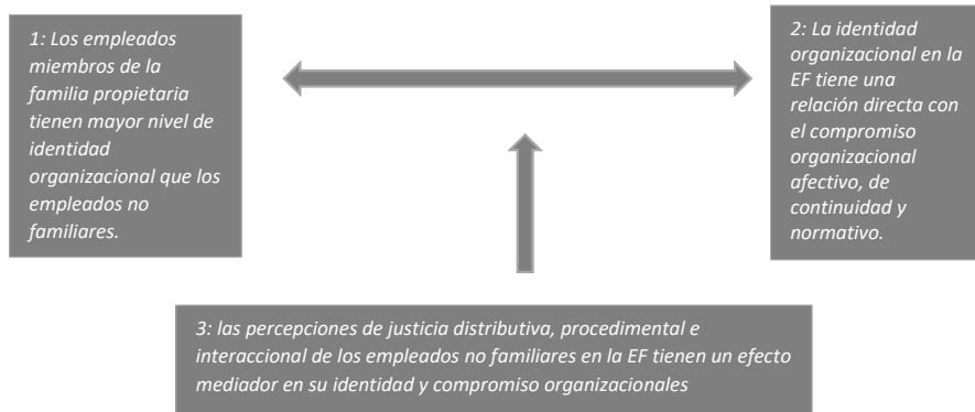
Figura 2 Supuestos teóricos desarrollados

Supuesto teórico 3: las percepciones de justicia distributiva, procedimental e interaccional de los empleados no familiares en la EF tienen un efecto mediador en su identidad y compromiso organizacionales.