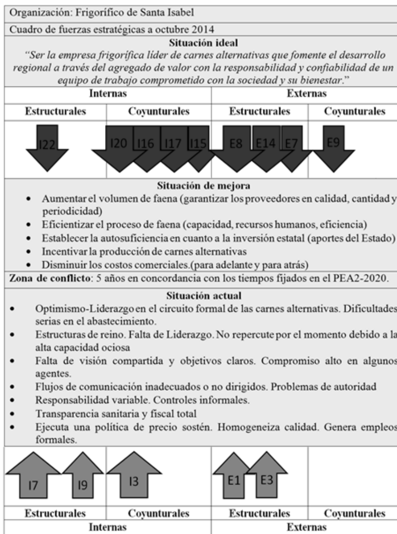
Figura 5. Cuadro de Fuerzas Estratégicas para el Caso bajo estudio

el volumen de faena garantizando calidad, cantidad y periodicidad; 2) eficientizar el proceso de faena considerando la capacidad y los recursos humanos; 3) establecer la autosuficiencia en cuanto a la inversión estatal (aportes del Estado); 4) incentivar la producción de carnes alternativas; 5) disminuir los costos comerciales con proveedores y clientes. El tiempo de mejora propuesto es de cinco años (a 2020) en concordancia con los objetivos fijados en el Plan Estratégico Agroalimentario Agroindustrial (PEA2-2020).