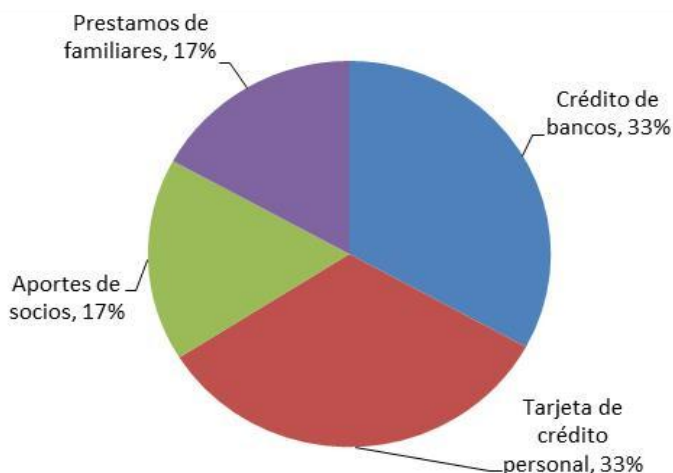
Gráfico 2. Fuentes de Financiamiento

Los empresarios manifestaron que se financian en un 33% con tarjeta de crédito personal, mientras que el otro 33% lo hacen a través de préstamos bancarios, un 17% recurre a préstamos familiares y un 17% solamente lo hace a través del aporte de socios. Estos resultados resultan preocupantes pues más de la tercera parte recurre a uno de los créditos más costosos que existen en el contexto mexicano como lo es la tarjeta de crédito personal, otro porcentaje alto lo hace a través de préstamos bancarios, los cuales también tienen un costo elevado. Esto se debería al poco poder que tienen estos empresarios para lograr obtener otro tipo de financiamiento menos costoso, ya sea vía proveedores o en su caso a través de fondos de fomento (Ver gráfico 2).