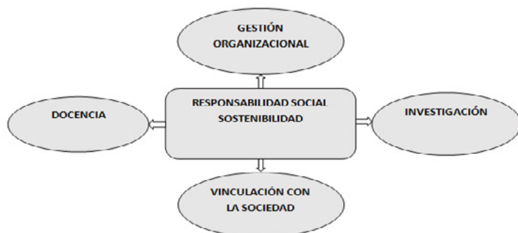
Figura 3. RSE, Sostenibilidad y funciones sustantivas de la Universidad

En base a la propuesta relacionada a la integración de los impactos 7 , stakeholders y las funciones sustantivas de la Universidad, es necesario e imprescindible declarar las acciones correctivas a tomar en cuenta para generar Sostenibilidad, las mismas que se originan de los impactos producidos en