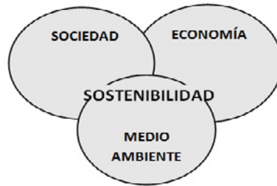
Figura 1. Dimensiones de la Sostenibilidad

propuesta conceptual que articula tres dimensiones: la social, la económica y la medio ambiental. Dentro de estas dimensiones se abarcan temas como la equidad social, las oportunidades de empleo, el desarrollo económico y el acceso a bienes de producción, los impactos ambientales y la calidad ambiental, la igualdad de género, el buen gobierno corporativo, entre otros más, considerándose tanto aspectos cuantitativos como cualitativos del desarrollo.