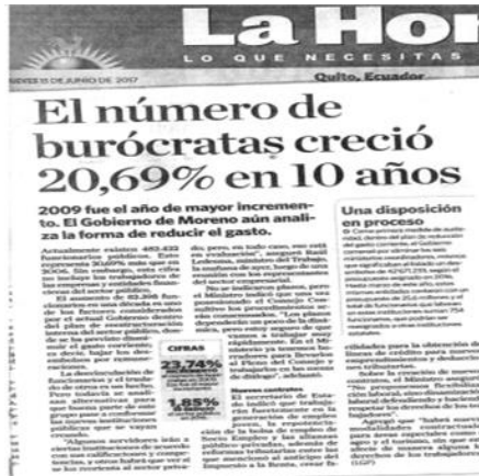
Imagen N° 2: Incremento de Burócratas

ya que se ha dado mayor importancia al ingreso de personal a la gestión de los macroprocesos habilitantes o adjetivos sobre los macroprocesos agregadores de valor o sustantivos en donde se requieren mayores competencias técnicas para el cumplimiento de la misión institucional.