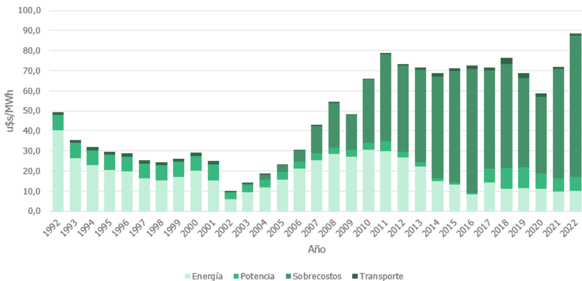
Figura 1. Precio monómico (u$S/MWh) - 1992 a 2022. Suma de los conceptos representativos de la generación de energía eléctrica en el Mercado Eléctrico Mayorista: energía (costos variables vinculados a la energía consumida), potencia (costos fijos por capacidad instalada) y transporte. Los sobrecostos surgen del costo adicional de combustibles importados respecto al doméstico. Fuente: Elaboración propia en base a CAMMESA (2023).

1. Respecto de la mejora de competitividad, los resultados del sistema no han sido positivos, ya que la persistente y creciente necesidad de importar energía, en particular gas oil y gas natural licuado (GNL), impactan de manera significativa en la balanza de pagos, el precio de la energía y en las cuentas públicas (como ejemplo, entre 2010 y 2019 se importaron U$S 24.400 millones sólo de gasoil, y a partir de 2011, las importaciones de GNL han oscilado entre U$S 3.000 y 8.000 millones anuales). En la figura 1 se aprecia la evolución del precio monómico 7 de energía eléctrica desde 1992 hasta 2022.