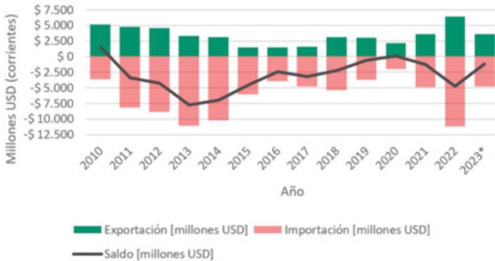
Figura 3. Intercambio comercial de hidrocarburos (2010-2023). Fuente: Elaboración propia en base a datos de SEN (2021). *Datos hasta agosto.

tica energética y la industrial tecnológica, los resultados tampoco han sido alentadores. La gobernanza de la estrategia tecnológica, lejos de estar vinculada con ecosistemas productivos locales, ha sido transferida a las casas matrices de los principales actores extranjeros del sector, quienes supeditan el desarrollo de proyectos al acceso a financiamiento externo y al imperativo de lograr amortizaciones rápidas para su repago o la remisión de utilidades.