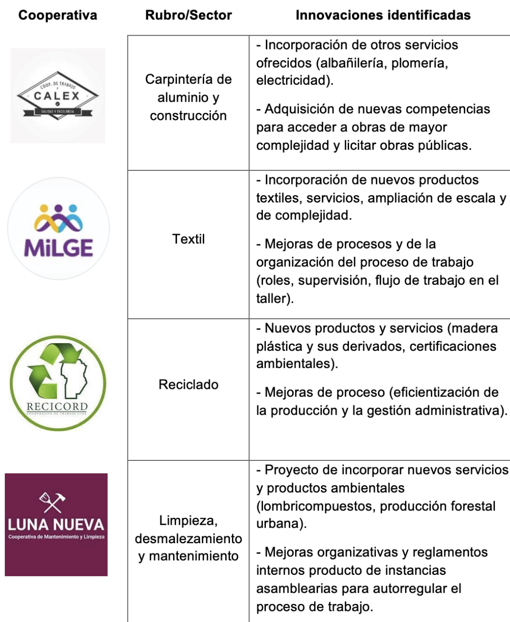
Tabla 2. Cooperativas de trabajo de la economía popular.

Hasta aquí, se ha dado cuenta de innovaciones que mejoran la adaptación al ambiente. Sin embargo, es