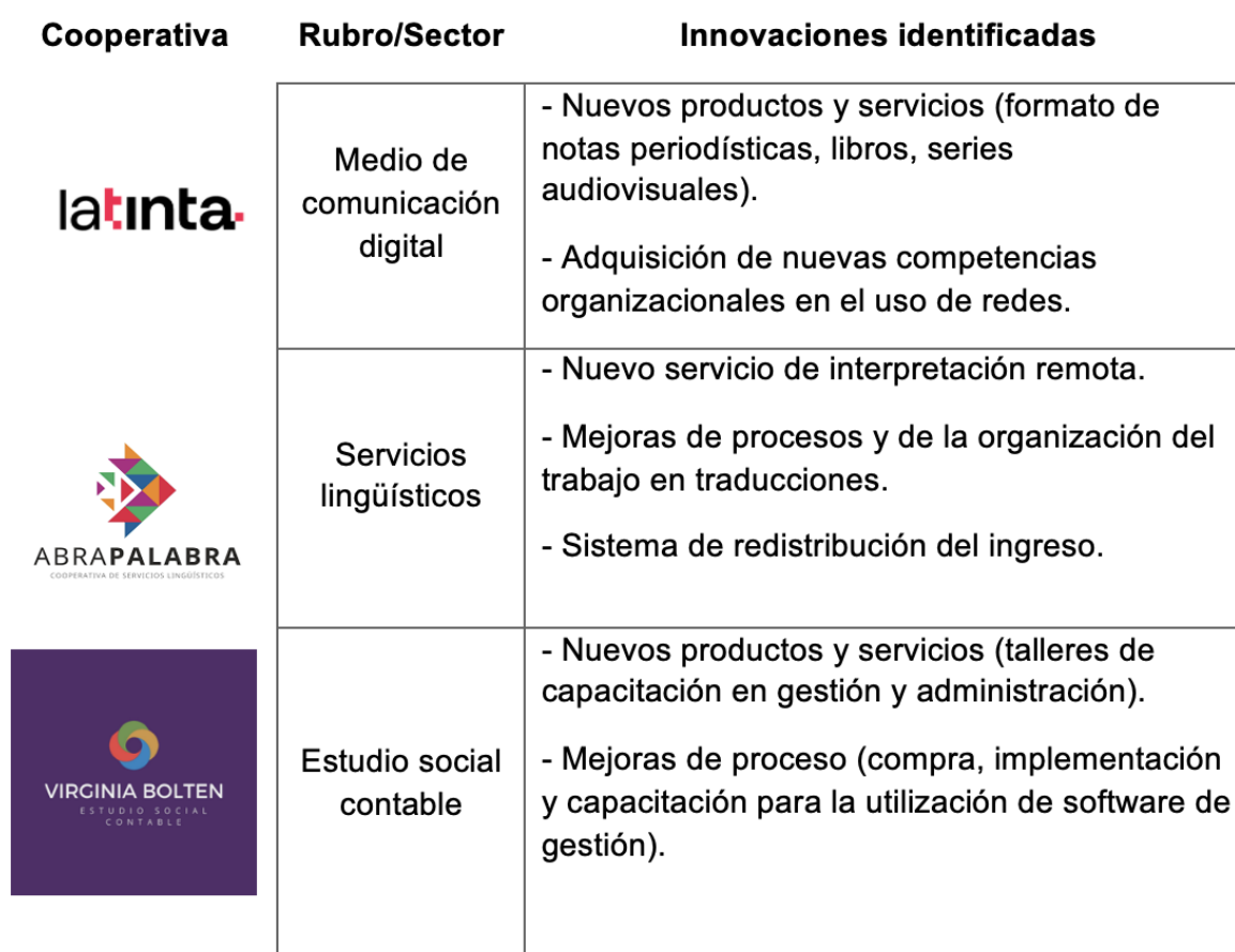
Tabla 1. Cooperativas de trabajo de servicios profesionales.

Como resultado de la investigación, ha sido posible identificar un conjunto de innovaciones llevadas a cabo por estas CT. De este modo, se encontraron innovaciones clasificables en las tipificaciones del Manual de Oslo 2 , es decir, aquellas innovaciones comúnmente asociadas a empresas convencionales (de producto, de procesos, comercial, organizativas). Sin embargo, es preciso establecer una diferencia significativa en la manera en la que se entiende la innova-