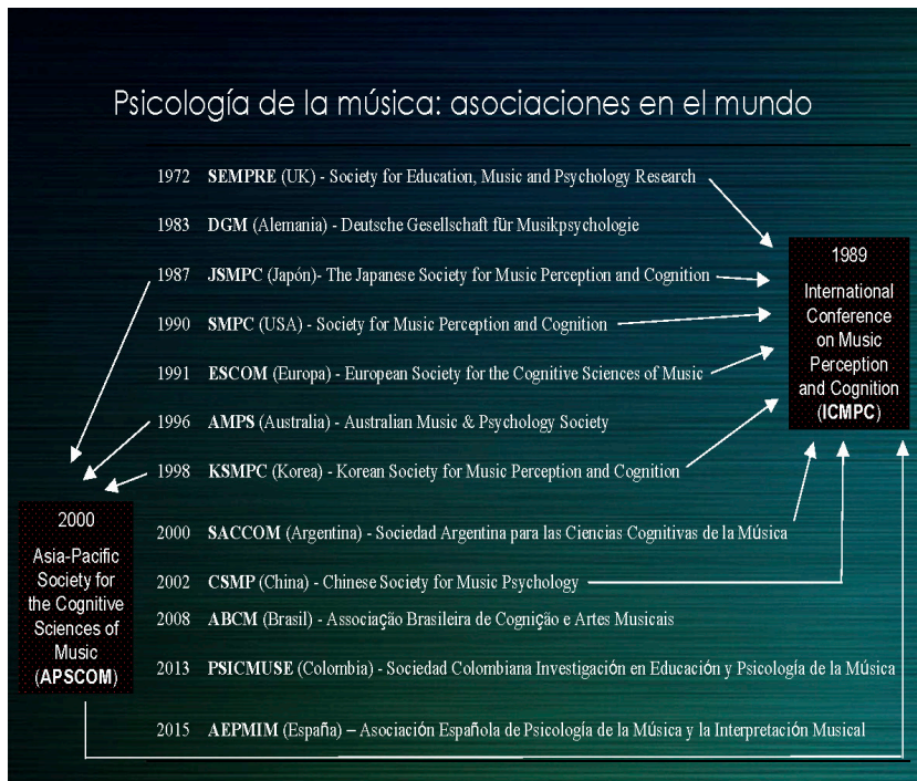
Figura 2. Asociaciones sobre psicología de la música a nivel internacional y año de fundación.

que tiene que ver con definiciones fundamentales del campo de la epistemología? (comunicación personal). La revista Epistemus abre por fin el camino a las publicaciones especializadas en psicología de la música en español, y esperamos que este sea sólo un primer paso hacia el establecimiento de una estructura sólida que garantice una actividad duradera. Más allá de las actividades de prevención e intervención, el objetivo global de AEPMIM podría ser alcanzar una psicología de la música que permita aunar a los músicos y a los psicólogos entre sí, que les permita comprender que se necesitan mutuamente, y ello promueva la motivación que sustente esa colaboración entre ambos tan necesaria, tan conveniente, pero todavía difícil.