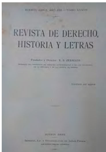
Portada de la Revista de Derecho, Historia y Letras , tomo XXXVII, año 1910, ejemplar disponible en la hemeroteca de la Biblioteca Nacional “Mariano Moreno”. Su lema: Scribere est agere (“Escribir es hacer”).]