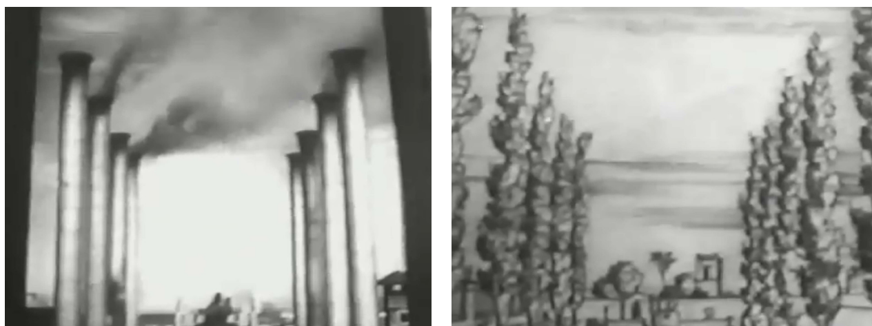
Figura 6: Fotograma de La ciudad frente al río .

“El Buenos Aires colonial era lógico y humano para su época, pero las casas crecieron hasta tapan el sol y ocultar el río”, indica la voz en off, mientras se alterna una representación de Buenos Aires como la “gran aldea” con un plano contrapicado de chimeneas humeantes (estableciendo una clara diferencia con otros planteos urbanos significativos, tales como el Proyecto de la Comisión de Estética Edilicia de 1925, que buscaba construir una continuidad y no una ruptura con el período colonial). (Ver Figura 6) El relato continúa, y luego se menciona la calidad de vida de los adultos y niños porteños afectada por la impureza del aire, debida al humo de los vehículos y de las chimeneas de las fábricas, fruto de “años de falta de planificación urbana”. Imágenes de congestión de autos, de construcción de hormigón, de tejidos densamente edificados acompañan el relato sobre el “caos urbano” de Buenos Aires.