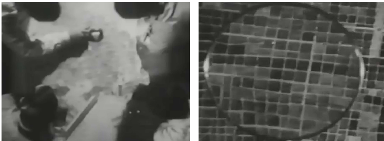
Figura 5: Fotograma de La ciudad frente al río .

De manera tal, el film comienza con lo que se presume es una vista aérea de un plano de Buenos Aires que está siendo analizada por un grupo de ¿especialistas, arquitectos urbanistas? vestidos con delantales blancos, como científicos o médicos, que la observan con una lupa. Una voz en off anuncia: “Todas las ciudades del mundo están enfermas, y Buenos Aires, como todas, sufre hoy las consecuencias de cien años de errores urbanísticos”. La voz continúa y homologa a los habitantes de la ciudad con hormigas que circulan por ella, mientras se suceden imágenes de un tejido urbano consolidado y una grilla maciza –“rejas de una inmensa cárcel”–, vista bajo una lupa, posible de ser pensada como un microscopio, a través del cual miran los especialistas-científicos. (Ver Figura 5)