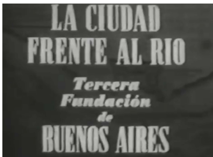
Figura 4: Fotograma de La ciudad frente al río .

Desde esta definición de Kriger es posible pensar que La ciudad frente al río propone una transformación global de la ciudad en clave lecorbusierana con un formato de docudrama. (Ver Figura 4) La estructura narrativa del film, de 9 minutos y 32 segundos, responde a la organización temporal de los hechos en dos secuencias: la primera, con una duración de 7 minutos, propone un diagnóstico sobre la situación de la ciudad de Buenos Aires en ese momento, definida como “enferma”, sin “sol, aire” o “espacio” e inscrita dentro de un “caos urbano”. La segunda parte, de 2 minutos y 32 segundos, se presenta superadora de la primera y propositiva de un proyecto urbano que permita materializar “la tercera fundación de Buenos Aires”, “conquistar el sol, el aire, el verde”.