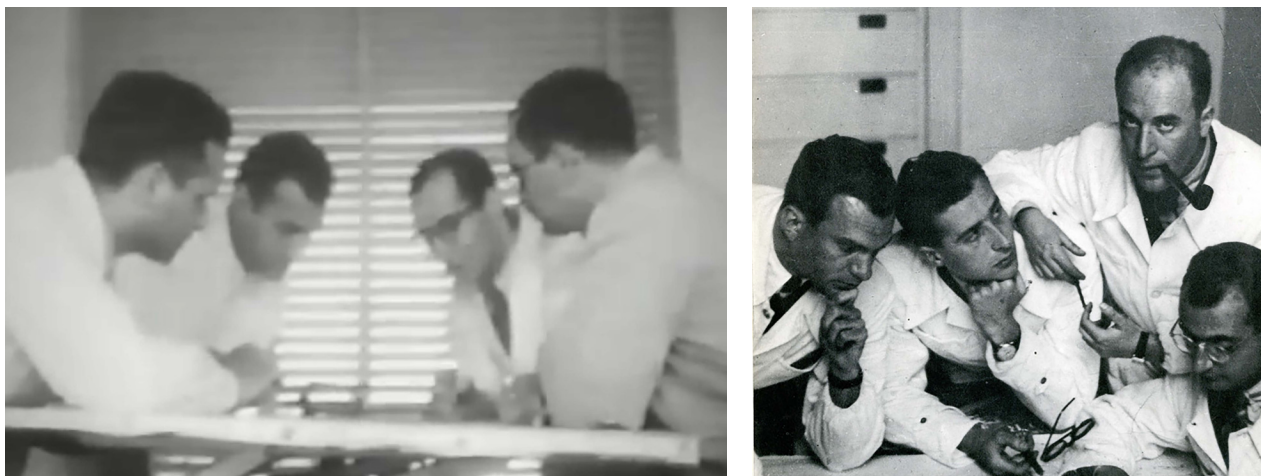
Figura 3: A la izquierda, fotograma de La ciudad frente al río . A la derecha, BBPR en 1932; arriba, a la derecha, Ernesto Nathan Rogers.