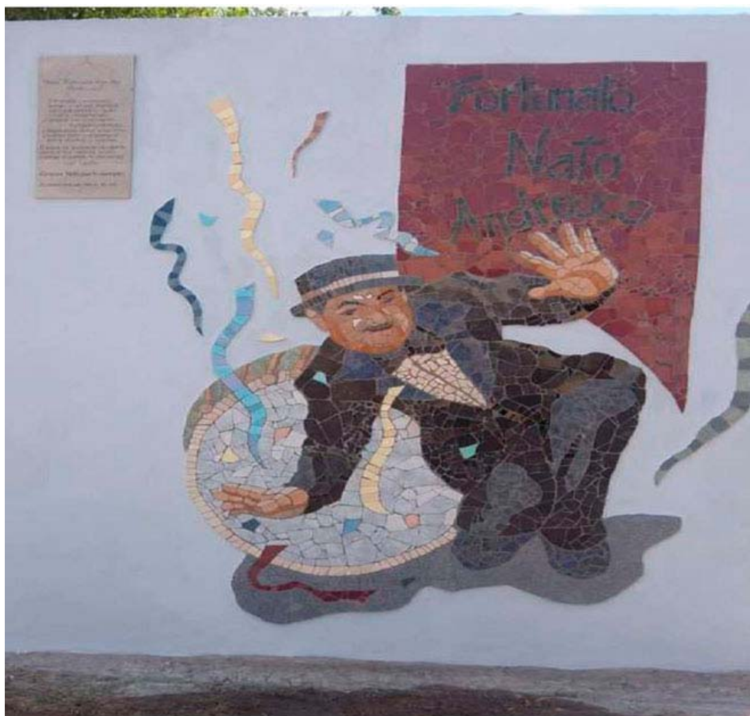
Figura 1. Mosaico Nato Fortunato Agustín Andreucci , (2011), El Rancho Urutau.

En Astilleros también se profundizaron las diferencias al interior de la estructura sindical, pero sobre todo, se recrudecía el conflicto entre el capital y el trabajo. Esta situación se traducía en el empeoramiento de las condiciones de trabajo, la equiparación de estatutos y convenios, la reclasificación de tareas y los premios a la producción, entre otras. Entonces, tanto en Astilleros como en las fábricas de la zona, el principal conflicto sindical estuvo vinculado al aumento salarial, la participación en paritarias y la discusión de los convenios colectivos de trabajo. A su vez, en este establecimiento, la salubridad, la se-