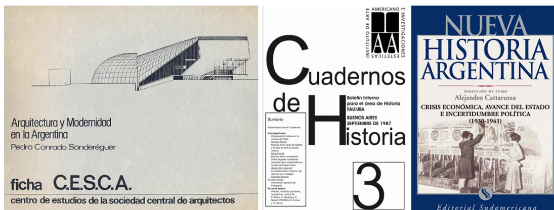
Figura 2: Operaciones historiográficas de revisión y recuperación