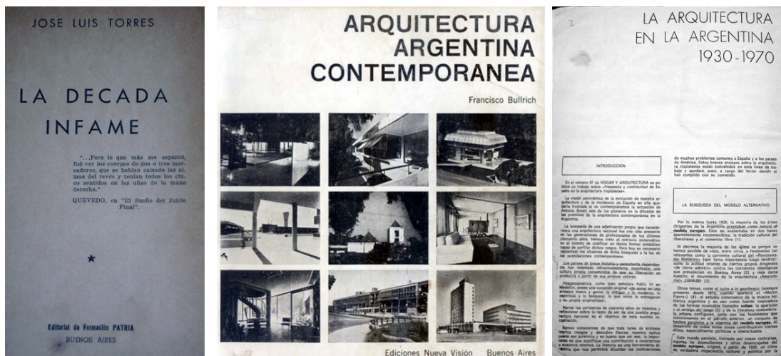
Figura 1: Textos que constituyeron la base de la interpretación historiográfica inicial