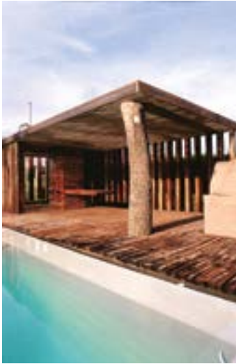
Figura 4. Fotografía de la Quincha Figura 5. Fotografía del Pabellón de Fiestas