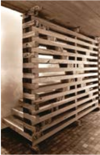
Figura 2. Fotografía de la Escalera. Figura 3. Fotografía del Quincho