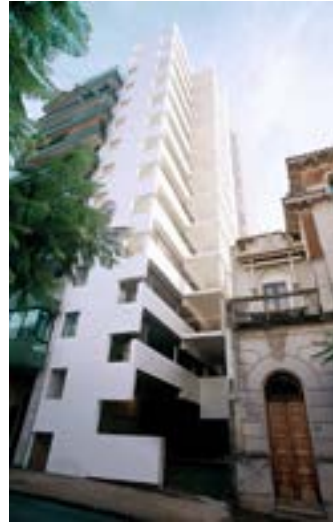
Figura 7. Fotografía del edificio Altamira