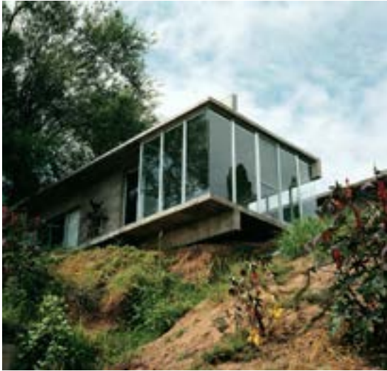
Figura 6. Fotografía de la Casa en la Barranca