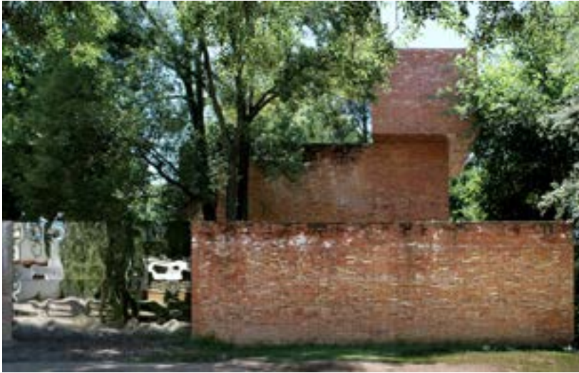
Figura 8. Fotografía de la Casa de la Cruz