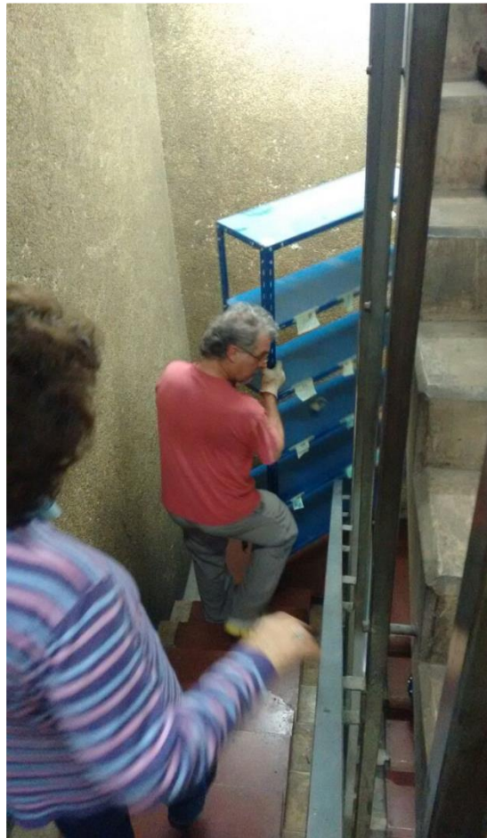
En el Espacio para la Memoria y los Derechos Humanos, exD2, bajando estanterías para armar el archivo.