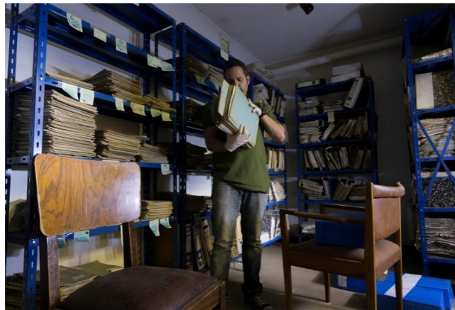
Preparando los legajos para su entrega

Ante todo lo dicho, quedó en evidencia que la Universidad Nacional de Cuyo, gracias a su estabilidad política y autonomía y sumado a la participación y el compromiso en temas de Derechos Humanos, se ha establecido como una institución confiable para la custodia de documentos tan sensibles y propensos a los ataques y vandalismo.