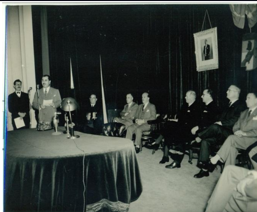
FMA0012 / FMA0014