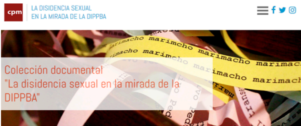
Imagen web Colección documental CPM "La disidencia sexual en la mirada de la DIPPBA"