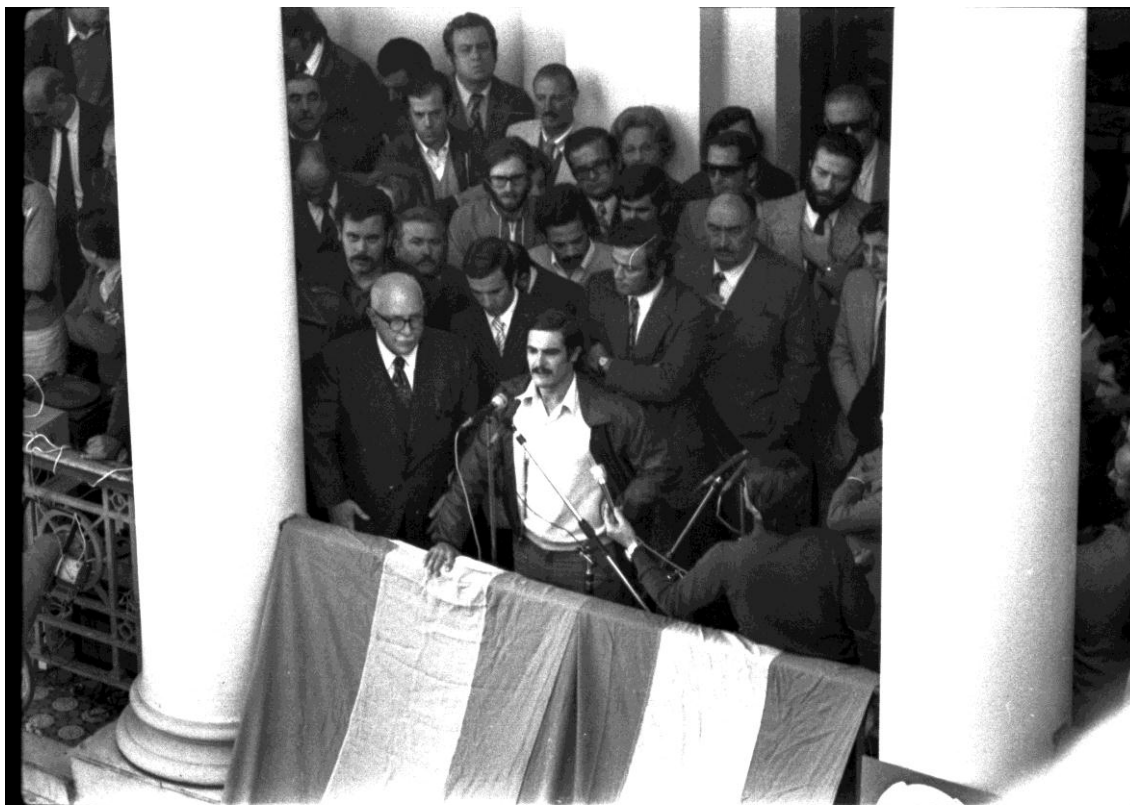
Acto cargo de autoridades administrativas (23-4-74)

En abril de 1974, asumían las nuevas autoridades de A.T.U.L.P. en un acto multitudinario en el patio de Presidencia de la Universidad. La Universidad vivía una época de medidas en pos de poner a la universidad al servicio del pueblo, pero la concreción de estas ideas no tardaría en provocar la reacción de la derecha peronista. La intervención de la Universidad era inminente. Miguel y Achem, fundadores de la Federación Universitaria para la Revolución Nacional y dirigentes de A.T.U.L.P., opositora de la gestión de Victorio Calabró en la provincia de Buenos Aires y del proyecto del ministro de Educación de la Nación, Oscar Ivanissevich, son asesinados en octubre de ese año.