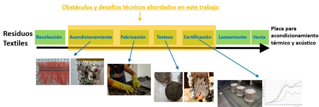
Figura 3. Esquema del proyecto con las etapas del desarrollo de un producto basado en residuos textiles. Figure 3. Scheme of the project with the stages of the development of a product based on textile waste.

con la misma base de fibras acrílicas y aglutinantes. Este trabajo hace hincapié en el sorteo de los diferentes obstáculos encontrados en el proceso de transformación del residuo en producto. Se abordaron los obstáculos y desafíos encontrados en las etapas de: acondicionamiento de residuos, la fabricación de las placas, el ensayo de las mismas en el taller y su certificación para el mercado en Argentina, según Yajnes y Busnelli (2023) (figura 3).