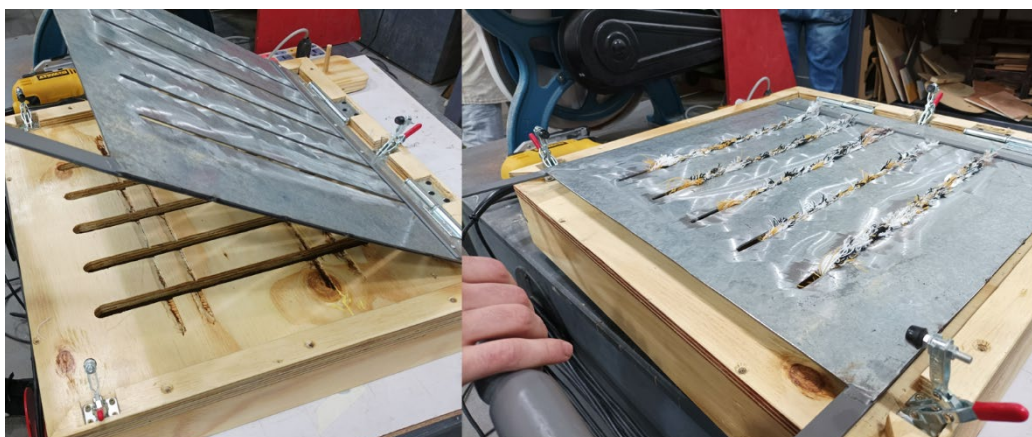
Figura 5. Cortador de residuos textiles en orillos y falsos orillos COT2 v2 Figure 5. Textile waste cutter for selvages and false selvages COT2 v2

residuos, para usar en el producto, se comenzó con lo que se consideró que sería una medida ideal de largo. Alcanzar esta medida demoraba mucho el proceso, por lo cual se cortaron piezas textiles de un largo máximo. Sin embargo, esto generaba una muy mala vinculación en la mezcla por lo cual se fue reduciendo hasta llegar a valor intermedio de largo. En este caso, de utilizarse una mezcladora, el material aún seguía enganchándose en las paletas mezcladoras. Por lo tanto, se ajustó nuevamente el largo de las piezas para pasar a la etapa siguiente de mezclado. Esto muestra la naturaleza iterativa, prueba y error, del proceso de ajuste de las dimensiones de las piezas textiles a incluir.