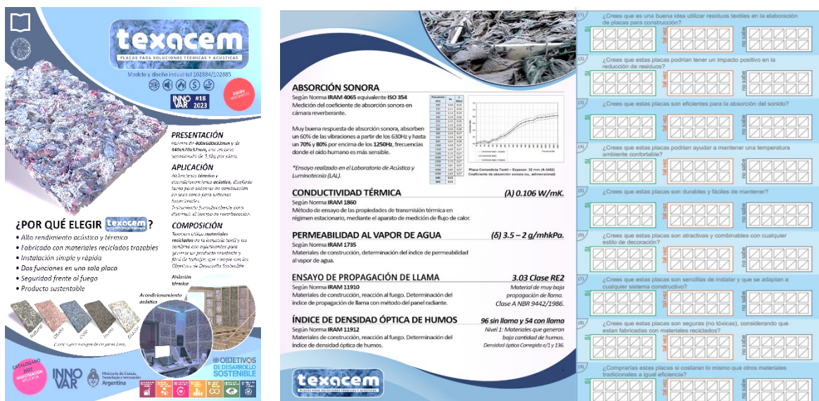
Figura 2. Kit de promoción folleto comercial, hoja técnica y testeo del producto. Figure 2. Promotion kit commercial brochure, technical sheet and product testing.

Se ha desarrollado un kit de promoción, que incluye un folleto comercial, una hoja técnica, un formulario de preguntas frecuentes y una tabla de testeo múltiple del producto (ver figura 2).