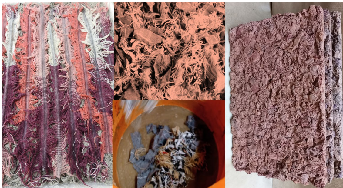
Figura 6. Proceso fabricación placas. Figure 6. Plate manufacturing process.

Un aspecto fundamental fue conseguir la integridad superficial para evitar un desprendimiento de polvo debido al uso de cemento común como aglutinante. Este obstáculo tuvo distintas soluciones, las cuales se encuentran actualmente en proceso de evaluación (físico, acústico y económico) que van desde el uso de pinturas, ya sea aplicadas a pincel o por aerosol, el sumergido en impermeabilizante y el empleo de una capa superficial con cemento blanco. Se está evaluando al mismo tiempo la sustentabilidad de todas estas opciones (figura 6).