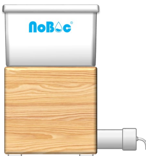
Figura 2. Sistema filtrante con capacidad de 5 litros. Figure 2. Filtration system with 5 liters capacity.