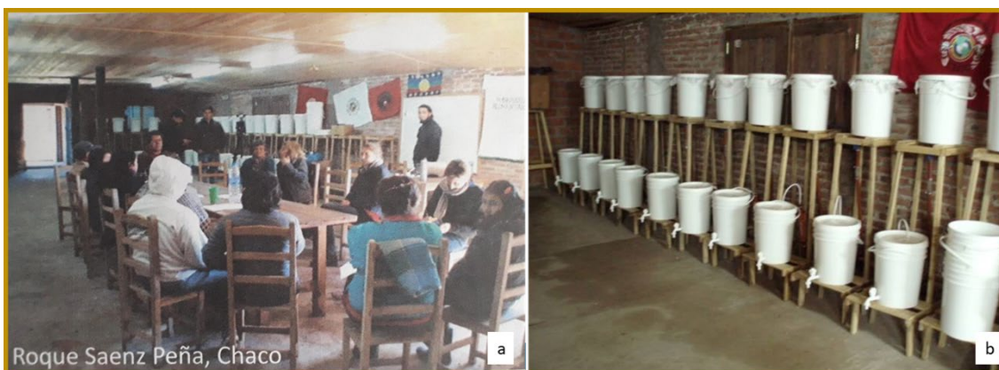
Figura 3. Experiencia en Cooperativa de Trabajo y Formación Poriajhú, Chaco. a) Talleres de acción participativa; b) Producción de filtros en la cooperativa.