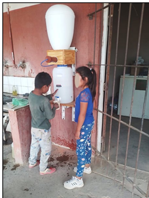
Figure 6. Water filtration system installed at the Rural School 4300, Fortín Belgrano, Salta.