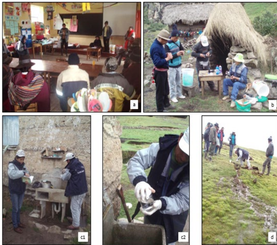
Figura 4. Talleres participativos de instalación de sistemas filtrantes en Lircay, Perú, 2015. a) Intercambio de saberes entre autoridades de la comunidad, vecinos, docentes y padres de los alumnos de establecimiento educativo de nivel primario; b) Preparación grupal de partes del sistema. Toma de muestra de agua para realización de análisis microbiológico y fisicoquímico: c1) y c2) en vivienda familiar; d) de vertiente.

ciertas pautas básicas: cantidad de niños presentes en el hogar; compromiso de construir las bases de madera para el soporte del sistema y que contaran con espacio para ubicar el mismo dentro de la vivienda para su mejor cuidado, evitando la exposición a la radiación solar directa.