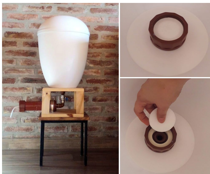
Figura 1. Sistema filtrante con capacidad de 20 litros instalado en vivienda particular del Gran La Plata. Figure 1. Filtration system with 20 liters loading capacity installed at a private home in Gran La Plata.

Los productos mínimos viables desarrollados se presentan en dos diseños diferentes, con capacidades de carga de agua de 20 litros (Figura 1) y de 5 litros (Figura 2).