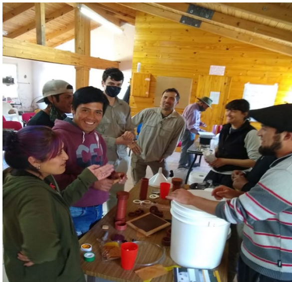
Figura 5. Experiencia comunitaria de capacitación en Aluminé, Neuquén.

En el año 2023, un nuevo diseño de prototipo de sistema filtrante se instaló en una escuela primaria de la provincia de Salta, gracias a la colaboración del grupo solidario Integración Neken Nanju, el Laboratorio Pyam S.A. y el director de la Escuela Rural 4300 de la localidad Fortín Belgrano, departamento de Rivadavia, Salta (Figura 6).