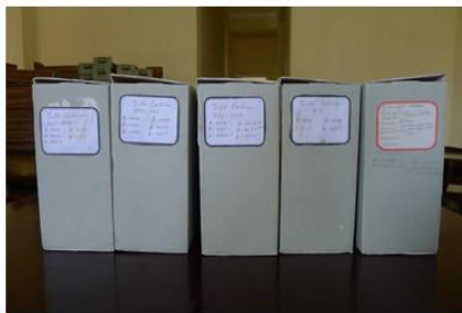
Archivo Cortázar de Casa de las Américas

Formas de lo común en América Latina: las producciones posrevolucionarias de Julio Cortázar