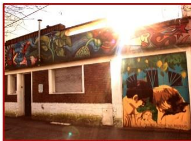
Casa El Bichicuí

Las representaciones sociales en torno al patrimonio y los sitios de memoria. El caso de los sitios “Mariani-Teruggi y “El Bichicuí” de la ciudad de La Plata.