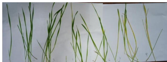
Figura 1 - Escala visual (EV) de daño de 1 a 9. Valores de 1 a 3 = tolerante; de 4 a 6 = medianamente susceptible y de 7 a 9 = susceptible.

Los datos encontrados son una primera aproximación que contribuye al conocimiento del daño que realiza el pulgón verde en los cultivares de triticale más utilizados en nuestro país. Este conocimiento puede