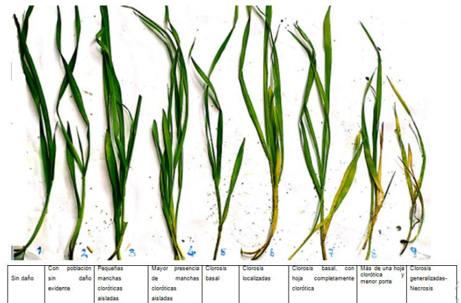
Figura 1 - Escala visual de daño del pulgón verde en cebada variedad Huilem.

La Evaluación visual del daño (EV) se clasificó según una escala (1= sin daño a 9= planta muerta o daño irreversible) que se construyó previamente tomando como referencia a la variedad Huilem, altamente susceptible (Figura 1). Los valores de 1 a 3 indican resistencia, de 4 a 6 moderadamente resistente a moderadamente susceptible y de 7 a 9 susceptible [9].