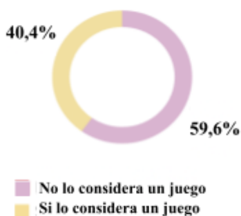
Gráfico N°1: La actividad “uso del celular, computadora, tablet y otros dispositivos digitales” ¿es considerada un juego?