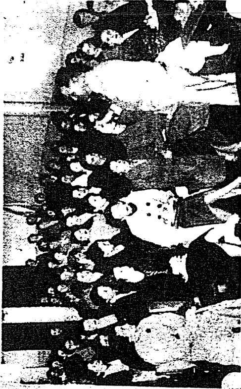
Nota tomada durante la primera clase dictada ayer en la nueva Escuela de Visitadoras

En el local del Colegio Recreativo, situado en la calle de la Princesa de Valparaiso, se celebró ayer la primera clase de los cursos de la Escuela de Visitadoras de Higiene de la Universidad de La Plata. La interesante iniciativa del Consejo Superior ha obtenido un éxito como repentinamente pudo verse.