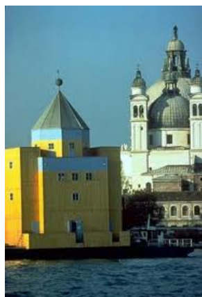
FIGURA 3 Teatro del mundo

Gracias a la arquitectura, nuestra casa toma la forma de nuestra alma, por lo cual es imperioso resguardar su intimidad; preservarla, aislarla; convertirla en un teatro flotante anclado a la línea municipal.