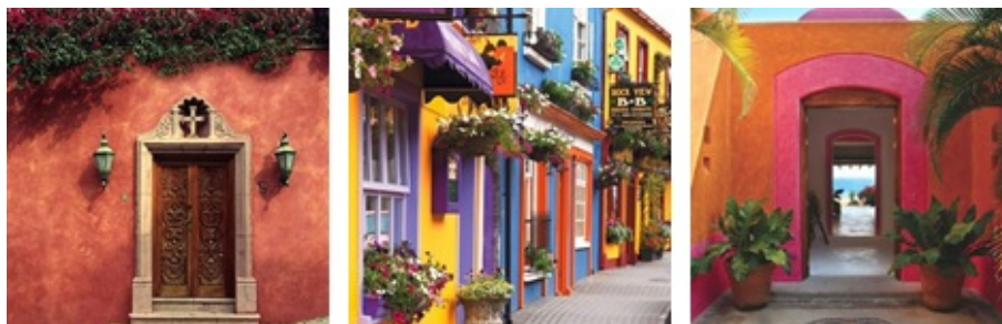
FIGURA 4 Umbrales – Telones – Escenografía Collage elaboración propia

Esa línea que encierra lo construido para que no desborde la manzana, marca la traza de un plano vertical continuo; ya sea que las fachadas se apoyen en ella materializándolo, ya sea que decidan retirarse y hacerlo presente a través de su ausencia.