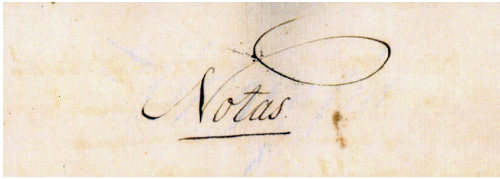
Fig. 1. Título

Estudiaremos una memoria manuscrita (11 páginas tamaño cuartilla) que, bajo el título Notas (fig. 1), fue presentada a los premios de la Real Academia de Medicina y Cirugía de Barcelona (actualmente Real Academia de Medicina de Cataluña) en el año 1831.