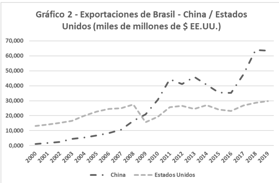
Gráfico 2 - Exportaciones de Brasil - China / Estados Unidos (miles de millones de $ EE.UU.)

Como también se puede ver en el Cuadro 2 y el Gráfico 2, en 2009, China superó a los Estados Unidos como el principal destino de las exportaciones brasileñas. También se observa que, entre 2018 y 2019, aunque las exportaciones a los Estados Unidos y China mostraron una tendencia al alza, las exportaciones a China alcanzaron más del doble de las exportaciones a los Estados Unidos. Como ya hemos señalado, el flujo comercial entre los dos países mostró un valor récord de casi US $ 100 mil millones. Este aumento significativo de las exportaciones brasileñas a China en estos dos años fue, en parte, el resultado de la desviación comercial causada por la guerra comercial entre Estados Unidos y China.