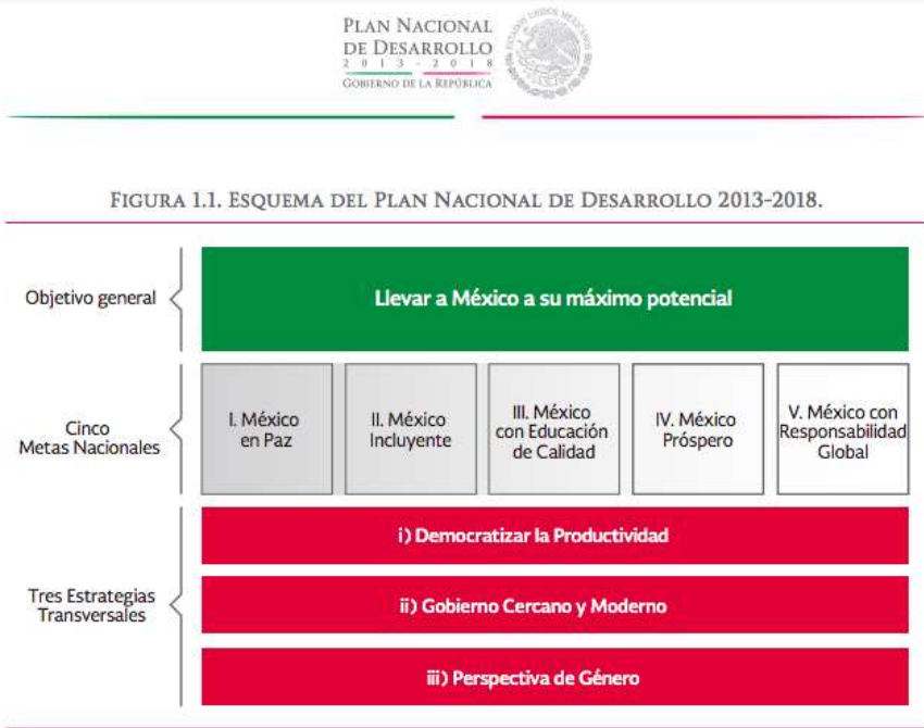
Figura 2. Esquema del Plan Nacional de Desarrollo 2013-2018