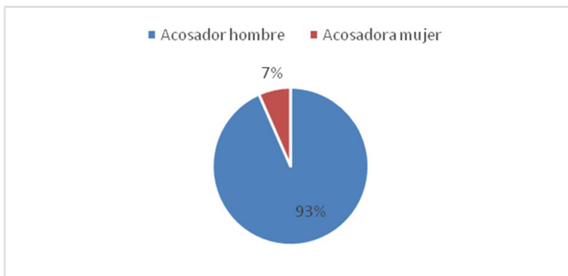
Gráfico N° 3