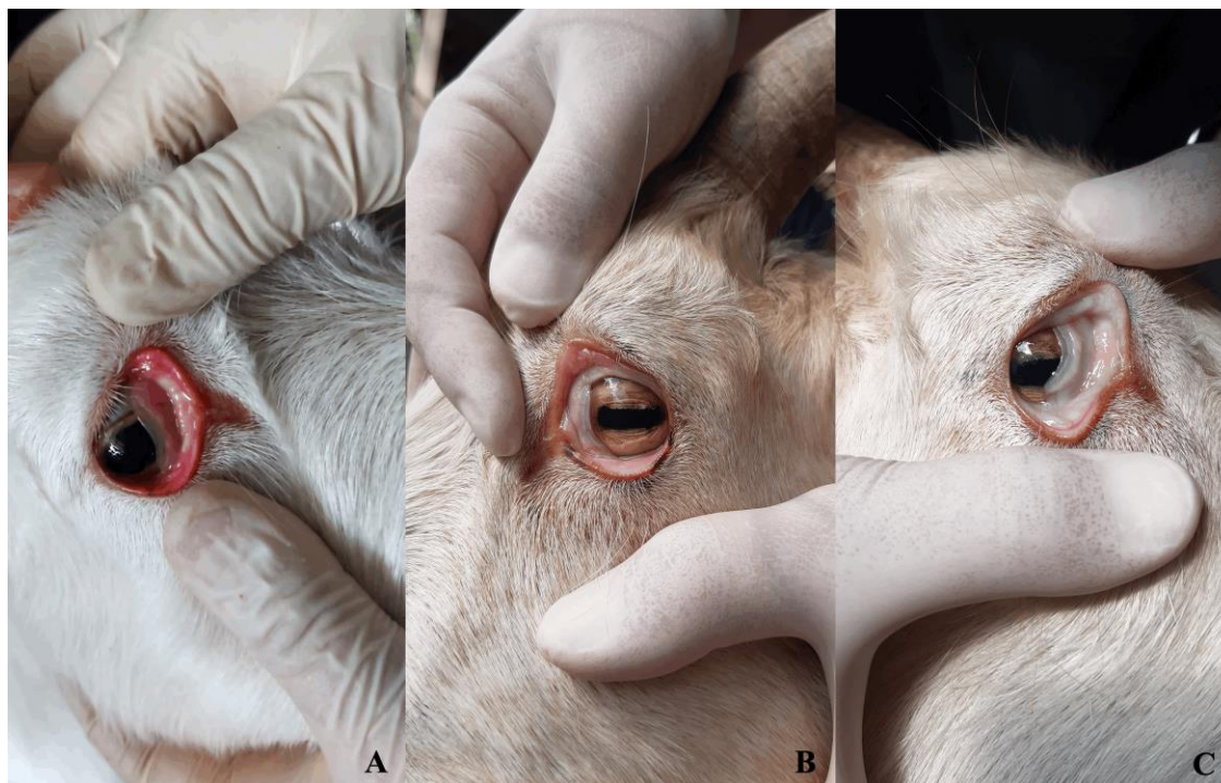
Figura 1. Evaluación de la coloración de la conjuntiva palpebral en cabras Saanen de dos establecimientos lecheros pertenecientes a la provincia de Buenos Aires. Se muestran las imágenes representativas de las categorías analizadas según grados de FAMACHA®: A- Aceptable (grados 1 y 2), B- Intermedio (grado 3) y C-Riesgoso (grados 4 y 5).

Para evaluar la relación entre el volumen de producción diaria de leche con el grado de FAMACHA®, la CC y la edad se utilizó la correlación de Pearson para variables continuas y una regresión polinomial ( Statgraphics Centurion XVI ). Los parámetros de los grupos formados y la asociación (FAMACHA® y CC) sobre el volumen de producción diaria de leche se compararon mediante el método de análisis de varianza (ANOVA o Kruskal Wallis – Statgraphics Centurion XVI ), con un nivel de significancia de 5 %. Las diferencias se consideraron significativas para valores de p \leq 0,05 .