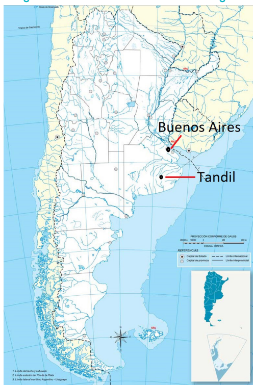
Imagen 1: Localización de Tandil en Argentina