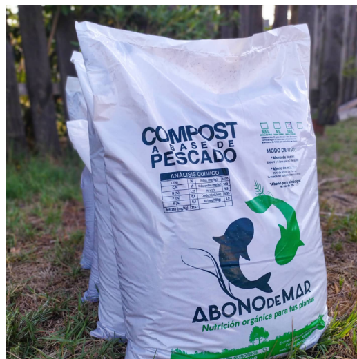
Figura 3 - COMPOST EMBALADO SOBRE BOSQUE PALOMENSE