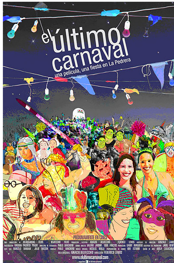
Figura 5 - AFICHE DE DOCUMENTAL SOBRE CARNAVAL LA PEDRERA Afiche de documental sobre Carnaval La Pedrera