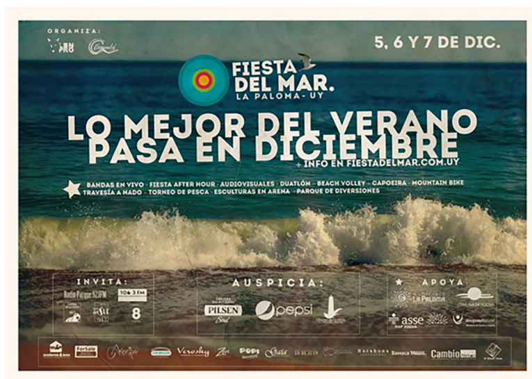
Figura 6 - DIFUSIÓN DE FIESTA DEL MAR Difusión de Fiesta del Mar