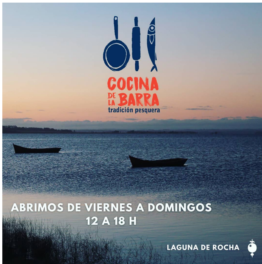
Figura 4 - IMAGEN DE DIFUSIÓN

Las investigadoras antes citadas, a su vez co-líderesas del proyecto junto a las pescadoras, conjugaron hechos-hitos para impulsar la sinergia colectiva a través de “la conmemoración, en forma intermedia y previa a logros mayores del proceso, de aspectos que podían considerarse un paso importante o fechas especiales que nucleaban al grupo” (Lagos et al., 2019: 126). Haber alcanzado los resultados evidenciados por CdB es fruto de esfuerzos continuados, acciones estratégicas, transparencia y participación en la gestión de fondos, intercambio de saberes locales con conocimiento técnico, entre otros factores. La mediación en el sentido propuesto por Velho (2010) entre el cotidiano de la Laguna de Rocha vivido por las mujeres pescadoras y múltiples ámbitos externos cercanos a las dos mujeres técnicas del proyecto, fueron claves desde un fluido tránsito de las segundas por ambos campos.