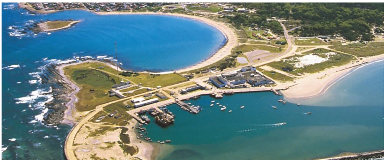
Figura 2 - VISTA PARCIAL DE LA PALOMA

En tal sentido, la investigadora continúa que dicha elección fue una constante durante su permanencia en el lugar, siendo que la misma “se fundamenta en la idea de que la vida palomense se caracteriza por la tranquilidad y por el contacto auténtico y cercano con la naturaleza (p.62). La antropóloga realizó un trabajo de campo en la localidad, a fin de indagar sobre disputas locales en torno a modelos de desarrollo que la construcción de un puerto de gran porte en la zona significaría. En ese proceso, dialogó con migrantes que, en busca de un cambio de estilo de vida, optaban por el “sacrificio de determinadas comodidades materiales o de la posibilidad de alcanzar un mayor poder adquisitivo” (p. 62).