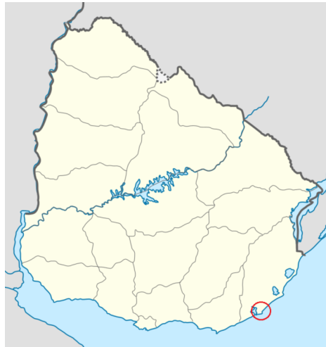
Figura 1 - MAPA DE URUGUAY CON LA LOCALIZACIÓN DE LA PALOMA