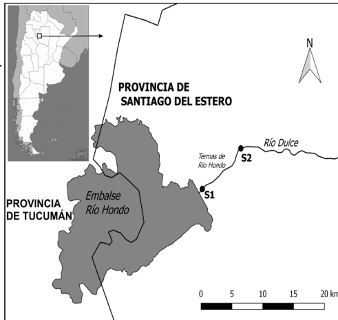
Figura 1. Localización del área de estudio y los sitios de muestreo.

es rocoso, con acumulación de arena en las zonas deposicionales de la ribera y en las islas. Sobre las riberas se observó desarrollo de macrófitas arraigadas y flotantes. El sitio S2 (27° 28' 36.21" S, 64° 49' 30.30" O) se localiza aguas abajo de la ciudad de Termas de Río Hondo, a una distancia de aproximadamente 8 km, medidas por el curso de agua (Figura 1). Este sitio se caracteriza por la presencia