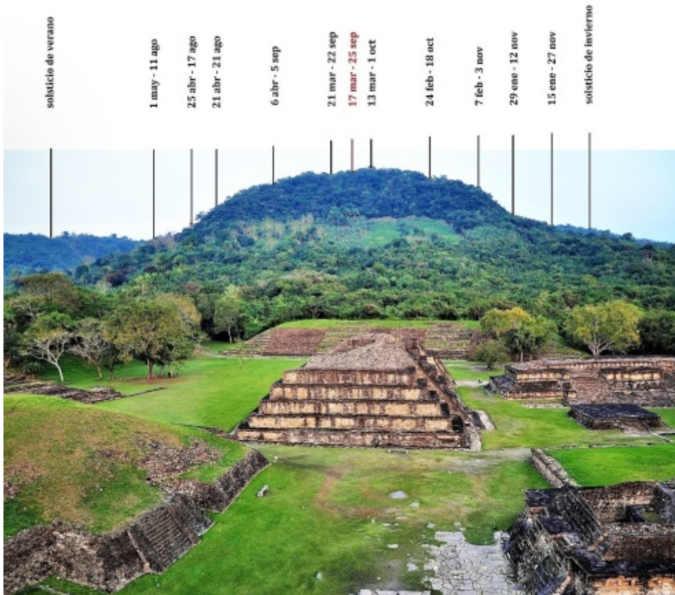
Figura 3. El calendario de horizonte oriente del cuerpo sexto de la Pirámide de los Nichos. Se indican las posiciones del sol en momentos importantes de año, así las salidas en los lugares llamativos del horizonte. La valoración de lo que es llamativo es subjetiva. En rojo se marca el alineamiento de la Pirámide de los Nichos. Se aprecia una hendidura ubicada en medio.

cuerpo séptimo. A pesar de estas diferencias se confirma que la alineación de la Pirámide apunta las salidas del Sol en 16-18 de marzo y 25-27 de septiembre y de ninguna manera se alinea con las salidas del Sol en 4 de marzo y 9 de octubre.