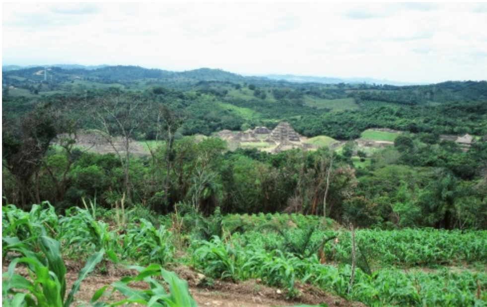
Figura 1. Vista general de la Zona Arqueológica El Tajín desde la parte baja del cerro Escolín. Se aprecia la silueta de la Pirámide Escalonada de los Nichos en el centro de la zona.

sobrepuestos de forma decreciente, cada uno acordonado por los nichos que en total suman 365 (García Payón 1951: 155-156) o 364 (Marquina 1990: 430, Morante López 2010: 65), lo que se atribuye a su posible significado calendárico: los 364 o 365 nichos pueden corresponder a la duración del año solar mesoamericano. De ahí se desprende la idea que la pirámide tiene importancia calendárica. El séptimo cuerpo corresponde al recinto ceremonial, hoy destruido. El edificio tiene la planta casi cuadrada de aproximadamente 35 metros de lado (Rivera Grijalba 1988: 69) y una altura de 25 (Krickeberg 1993: 332; Piña Chan y Castillo 1999: 55, Galindo Trejo 2004: 377) o 22 metros (Morante López 2010: 63). Aunque los planos de la pirámide suelen presentarla con los paramentos en línea recta, en realidad, no lo son. Los muros de los cuerpos sobrepuestos más bajos se quedaron "abombados" o cóncavos lo que Rivera Grijalba (1986: 71) atribuye a la presión horizontal del material de