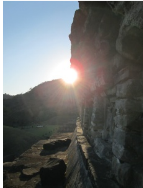
Figura 5. La salida del sol en el día 18 de marzo de 2013, un día después de la alineación solar. Paramento norte, sexto cuerpo.

Sánchez Nava (ver Figuras 4 y 5). No obstante, para Galindo Trejo el edificio apuntaría en la dirección de la cima ubicada a la derecha (sur) de dicha hendidura, ya bajando de la parte más alta, para marcar los ortos solares en los días 4 de marzo y 9 de octubre.