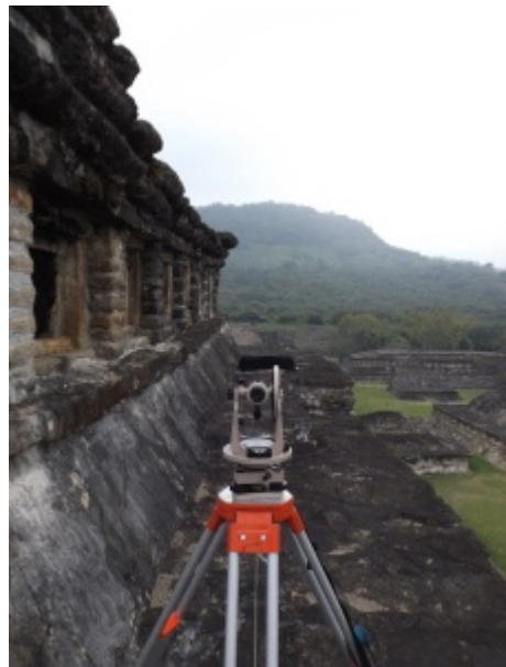
Figura 6. La alineación del paramento sur del cuerpo sexto de la Pirámide de los Nichos. La posición del teodolito marca las salidas del sol en 18 de marzo y 26 de septiembre.