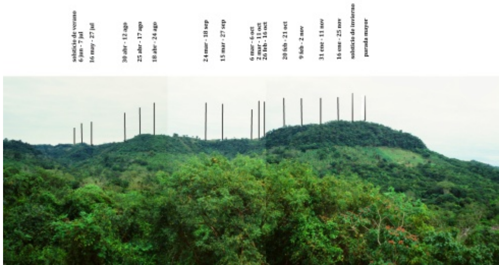
Figura 7. El calendario de horizonte oriente de la Estructura 42. Se indican las posiciones del sol en momentos significantes del año en las formas del paisaje importantes.

Ahora bien, tomando en cuenta la alargada y ondulante silueta del cerro Escolín, se puede especular sobre su posible función calendárica. Observado desde la cúspide de la Pirámide se nota que este macizo montañoso marca los ortos solares entre los finales de enero y principios de mayo (mediados de agosto y mediados de noviembre) lo que constituye el intervalo de más o menos 91 días divisible entre 13 (ver Figura 3).