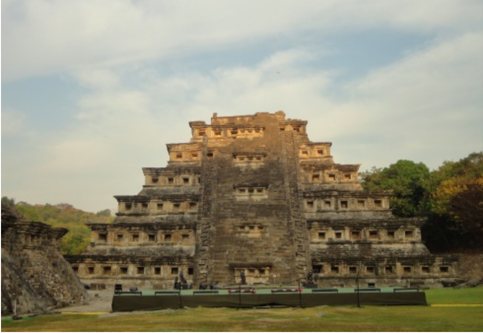
Figura 8. La iluminación del cuerpo séptimo (la cúspide) de la fachada este de la Pirámide de los Nichos en los días cercanos al equinoccio.