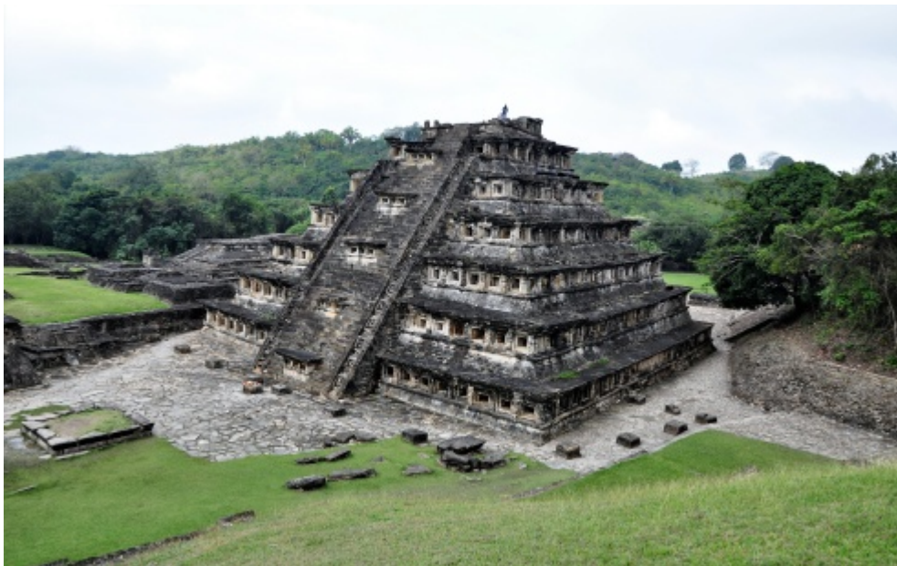
Figura 9. La Plaza Este observada desde la Estructura 4. Se trata de la conformación del espacio ritual.