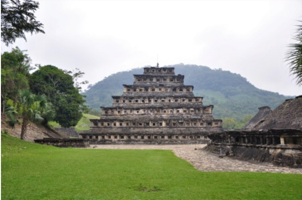
Figura 10. La relación visual entre el cerro Escolín y la Pirámide de los Nichos observada desde la entrada a la Plaza Oeste. Se nota que el centro de la cúspide de la pirámide coincide con la hendidura del cerro. Aunque la foto parece demostrar sugestivamente la alineación entre la entrada a la plaza, la pirámide y el cerro, no obstante, la abertura de la entrada no es lo suficientemente estrecha para identificarla sin cierto escepticismo. Este alineamiento no se refiere a la orientación de la pirámide misma.