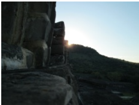
Figura 4. La salida del sol en el día 18 de marzo de 2013, un día después de la alineación solar. Paramento sur, sexto cuerpo.

Desde la Zona Arqueológica, especialmente desde la Zona Central, El Tajín Chico y la Estructura 42, en la silueta de El Escolín se percibe una pequeña hendidura que presenta la impresión de que el cerro tiene dos elevaciones cumbres. Para un observador parado en la cúspide de la Pirámide, es este el lugar en donde se aprecia la salida del sol en el día del equinoccio (ver Figuras 3 y 5a). No obstante, tal como lo demuestran los estudios, la pirámide se dirige hacia la cima ubicada a la derecha (al sur) de dicha hendidura, para marcar los ortos solares unos días antes del equinoccio. En la Figura 3 se marca la ubicación del orto solar en el día 17 de marzo, la dirección señalada por el alineamiento del paramento norte del cuerpo sexto. Esta posición del orto solar se encuentra cerca del lugar determinado por Šprajc y