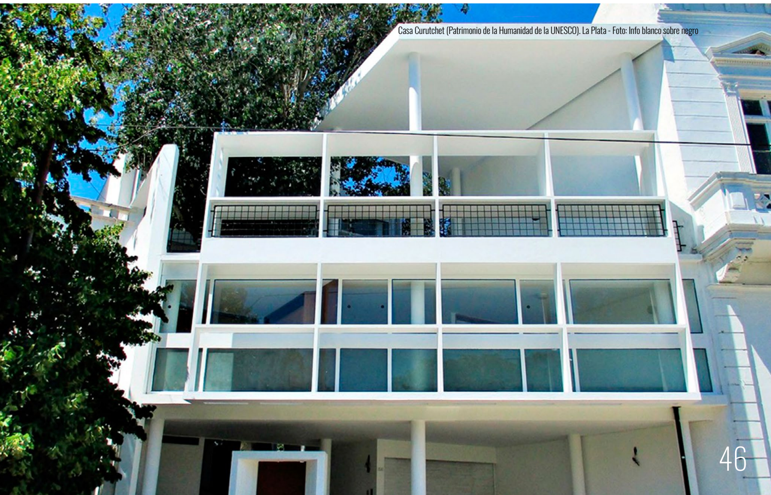
Casa Curutchet (Patrimonio de la Humanidad de la UNESCO). La Plata

La ciudad de La Plata es uno de los municipios relevados con mayor cantidad de recursos turísticos en toda la Provincia. Como es de esperar, la tipología de recursos que predomina (más del 50%) son los recursos históricos: sus museos, palacios, teatros, la Casa Curutchet (Patrimonio de la Humanidad de la UNESCO), bibliotecas, iglesias (destacándose la Catedral de la Inmaculada Concepción). Es importante mencionar, entre sus