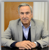
Cr. Carlos Zandoná