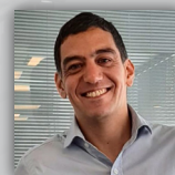
Cr. Augusto Patané