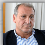
Cr. Ricardo Angelucci