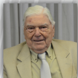
Cr. Oscar Boragina