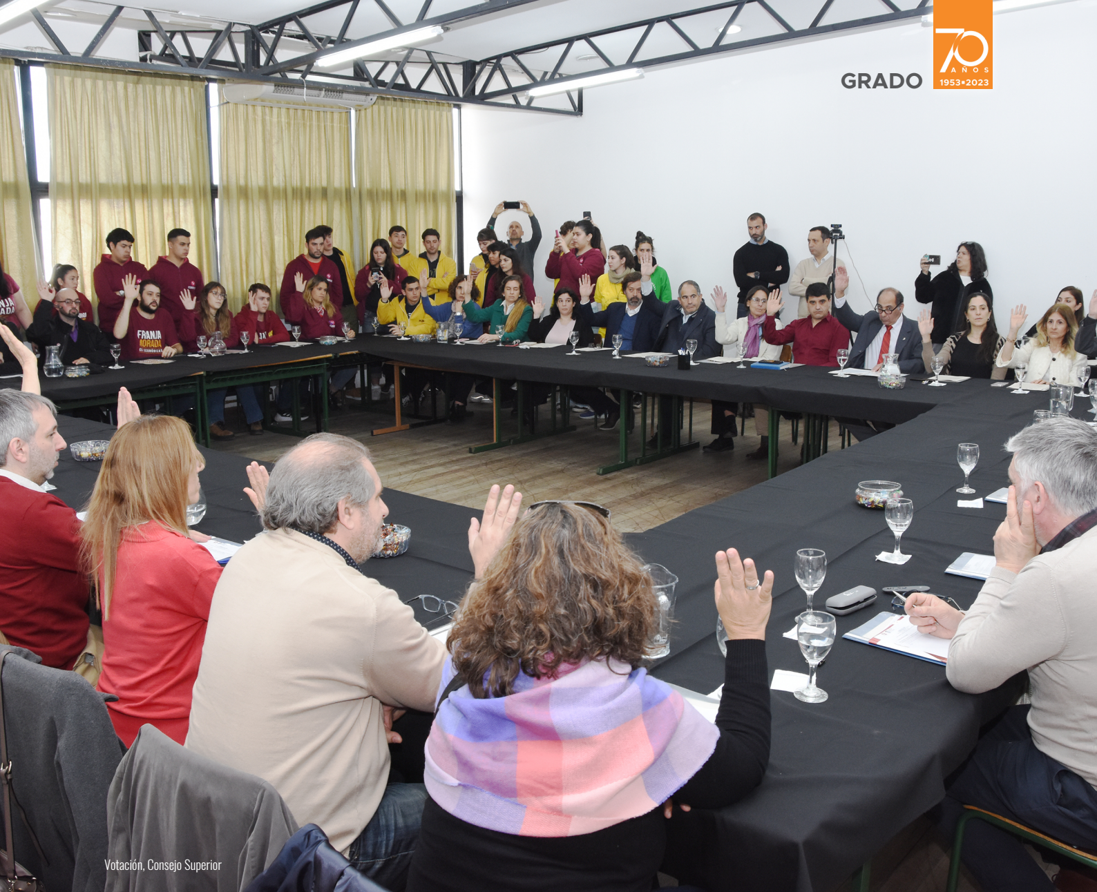
Votación, Consejo Superior

EL CRECIENTE Y CONSTANTE AVANCE TECNOLÓGICO HA TRANSFORMADO POR COMPLETO LA FORMA EN QUE OPERAN LAS ORGANIZACIONES Y LOS NEGOCIOS A NIVEL GLOBAL. LA DIGITALIZACIÓN MASIVA Y LA ADOPCIÓN DE INTELIGENCIA ARTIFICIAL HAN DADO LUGAR A UN INCREMENTO EXPONENCIAL EN LA GENERACIÓN DE DATOS.