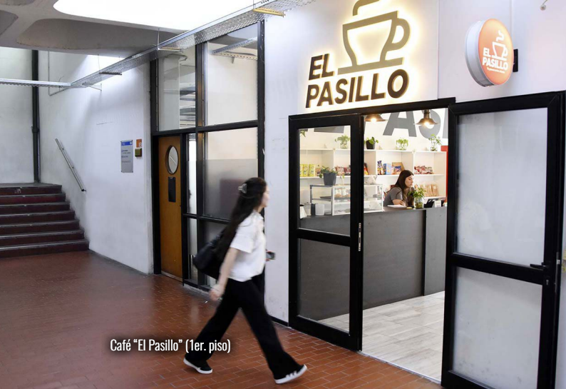
Café "El Pasillo" (1er. piso)