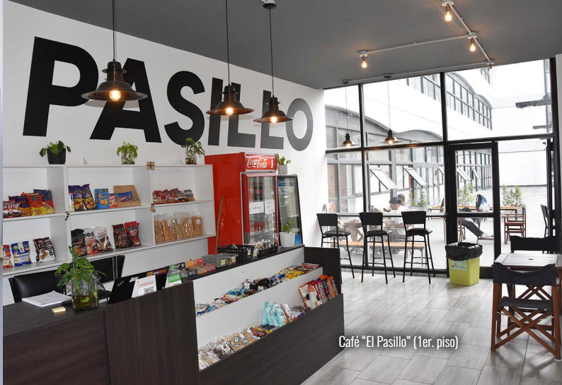
Café "El Pasillo" (1er. piso)