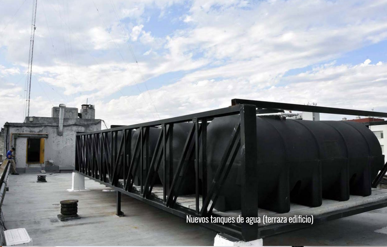
Nuevos tanques de agua (terraza edificio)