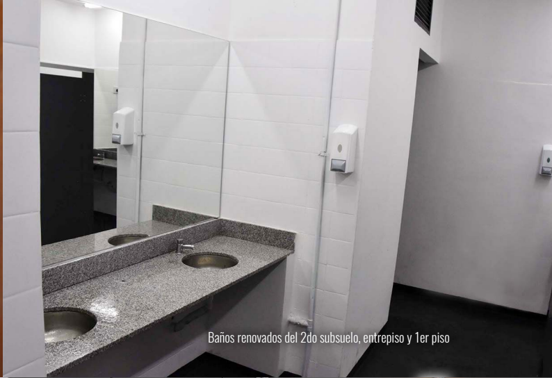
Baños renovados del 2do subsuelo, entrepiso y 1er piso