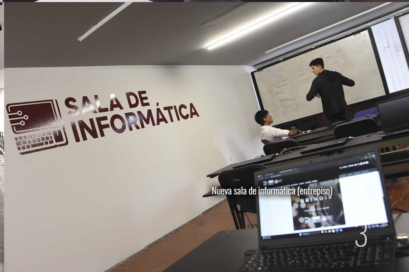
Nueva sala de informática (entrepiso)