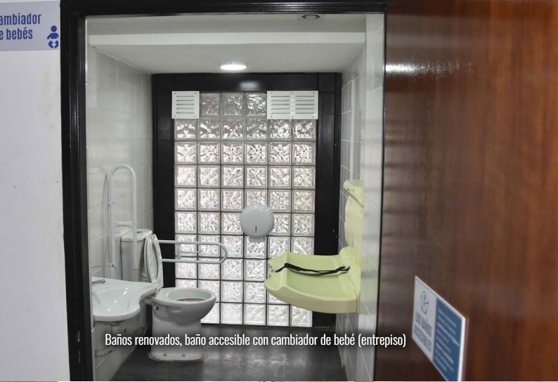
Baños renovados, baño accesible con cambiador de bebé (entrepiso)