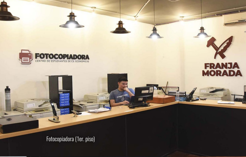
Fotocopiadora (1er. piso)