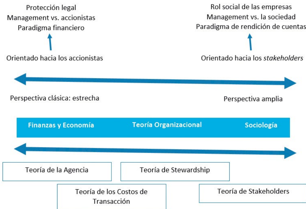
Figura 2. Adaptado de Letza (2004).