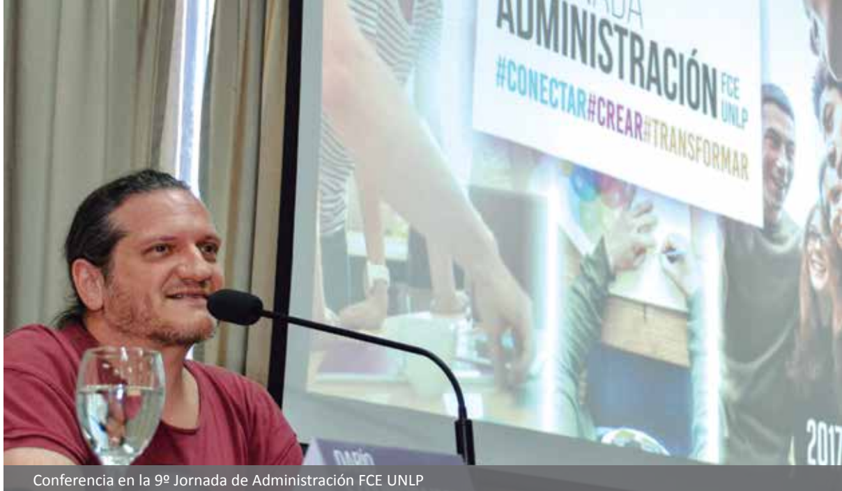
Conferencia en la 9ª Jornada de Administración FCE UNLP

Has hablado, en otras ocasiones, de la burocratización y de la erotización del saber, como conceptos que hablan, por un lado, de la cuestión evaluativa y, por el otro, de cómo acercarse al estudiante, cómo encarar ese diálogo. ¿Son estos dos conceptos formas en pugna hoy en día a la hora de tratar la educación?