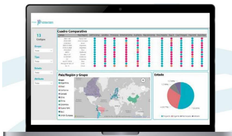
Fig.6 - Tablero comparativo del estado normativo en IA en distintos países y organismos internacionales. Fuente: elaboración Dirección provincial de Innovación Digital.

En el proceso de elaboración de una estrategia de Inteligencia Artificial (IA) para el ámbito público, resulta fundamental realizar un relevamiento de antecedentes normativos a nivel internacional. Este análisis permite identificar buenas prácticas, enfoques regulatorios y principios éticos adoptados por distintos Estados, sirviendo como insumo clave para el diseño de directrices locales que aborden los desafíos específicos de la administración pública bonaerense. Como primer paso, se llevó a cabo una revisión exhaustiva del estado del arte en materia regulatoria a nivel global. A partir de la información recabada, se desarrolló un tablero interactivo en línea (ver Fig.6) que permite visualizar y comparar el grado de avance de diversas jurisdicciones, constituyéndose en una herramienta dinámica de consulta para el proceso de formulación de políticas públicas basadas en IA.