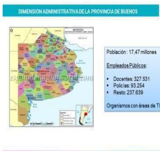
Fig.4 – Empleados de la PBA.