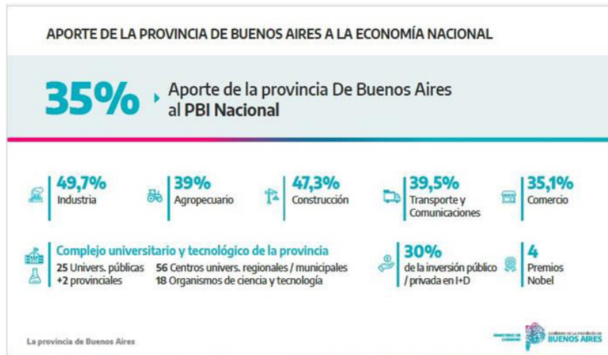
Fig.3 – Aporte económico a la nación.

En este marco, la estrategia de IA adoptada por la Provincia se propone potenciar el uso de la tecnología al servicio de la ciudadanía, priorizando una gestión más eficiente, transparente, inclusiva y equitativa. El camino hacia la transformación digital no solo implica innovar en herramientas y plataformas, sino también repensar el rol del Estado como garante de derechos y constructor de soluciones que mejoren la vida de las personas en todo el territorio provincial.