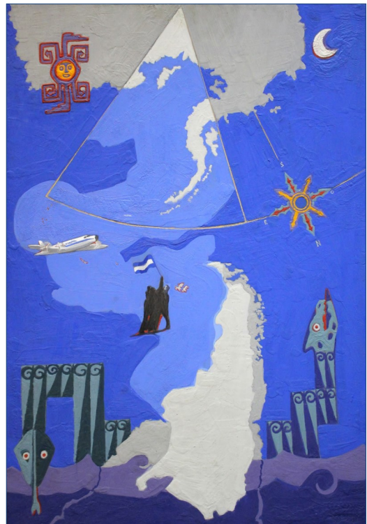
Figura 3. Mapa bicontinental de Nicolás Boschi (2020) Colectivo artístico América en Colores ( https://www.americaencolores.com.ar/ )