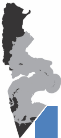
Figura 2. Nuevo mapa de la República Argentina de la Oficina cartográfica de Pablo Ludwig (1914).