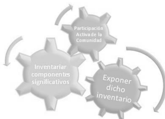
Imagen Nº 2: Inventario del patrimonio cultural

Resumidamente, la elaboración del inventario del patrimonio cultural, implica: