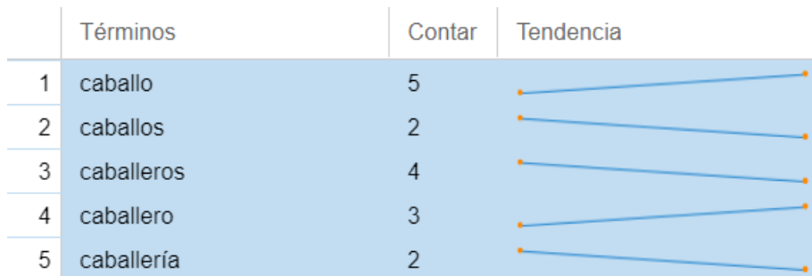
Figura 8. Herramienta Terms mostrando las palabras relacionadas con las unidades de caballería. Elaboración propia.

El uso de caballos durante los primeros años de la conquista fue considerado uno de los elementos más importantes cuando se combatía contra los naturales . Sin embargo, durante las guerras civiles, esta unidad les dio a los ejércitos españoles la movilidad que necesitaban. Asimismo, los caballos fueron testigos de duelos caballerescos, lanza en ristre, entre personajes importantes de ambos bandos.