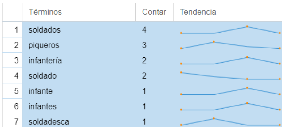
Figura 4. Herramienta Terms mostrando las palabras relacionadas con la infantería con pica. Elaboración propia.

En los campos de batalla europeos, los piqueros eran utilizados en el clásico escuadrón cuadrado, pero también en otras estrategias y usos afines. Estos iban armados con una pica (de ahí su nombre), es decir, una especie de lanza que medía entre 3 a 5 metros y, debido a su extremo filoso, otorgaba una defensa efectiva frente a la caballería. Por otra parte, cuando dos unidades enemigas de piqueros se encontraban, protagonizaban encarnizados combates, tal como cuenta Riva Agüero.