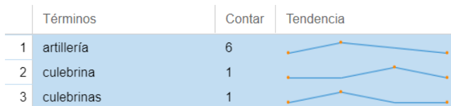
Figura 12. Herramienta Terms mostrando las palabras relacionadas con la artillería. Elaboración propia.

En este período, el uso de artillería era reducido debido a las dificultades para abastecerse de pólvora. Además, a causa de la geografía y la logística, era más sencillo el manejo de artillería ligera, como las culebrinas. Además, es importante señalar que términos como armas de fuego no han sido incluidos pues podrían hacer referencia tanto a la artillería como a las armas de fuego portátiles.