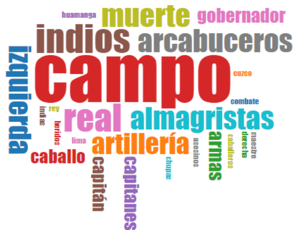
Figura 2. Nube de palabras generada por la herramienta Cirrus. Elaboración propia.

Posteriormente, con la herramienta Cirrus, no solo filtramos palabras como artículos, preposiciones, etc., sino que descartamos los nombres propios y términos relacionados pues estos no eran relevantes para nuestro análisis de las unidades desplegadas en la batalla. Los resultados obtenidos llaman la atención.