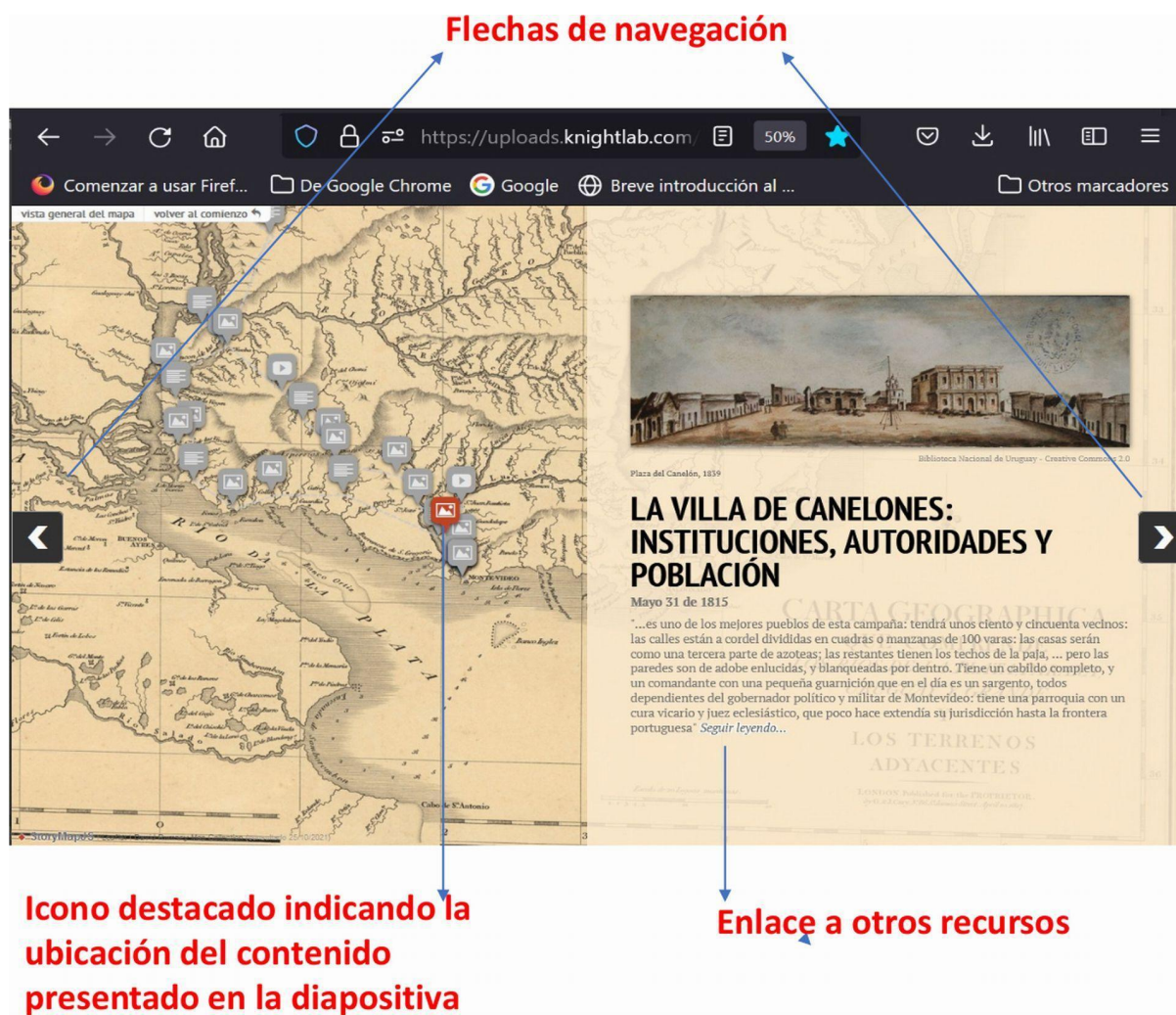
Figura 2. Visualización de una de las diapositivas del Diario del viaje de Montevideo a Paysandú en StoryMapJS.

La interfaz de edición habilita cierto grado de personalización de aspectos referidos a la apariencia del storymap . El usuario puede seleccionar el idioma de los controles, los tipos de letra, los colores de fondo del contenido presentado en las diapositivas y personalizar los marcadores de ubicación. Finalmente es posible activar líneas en el mapa, indicadoras de rutas o trayectorias en el caso de que se considere relevante para los objetivos de la presentación. La siguiente imagen muestra la interfaz de edición de la herramienta: