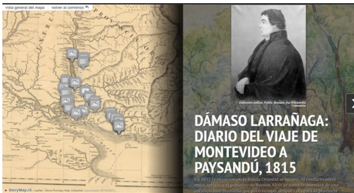
Figura 1. Visualización de la presentación del Diario del viaje de Montevideo a Paysandú en StoryMapJS .

interactiva del Diario del viaje de Montevideo a Paysandú en StoryMapJS está disponible en línea 11 .