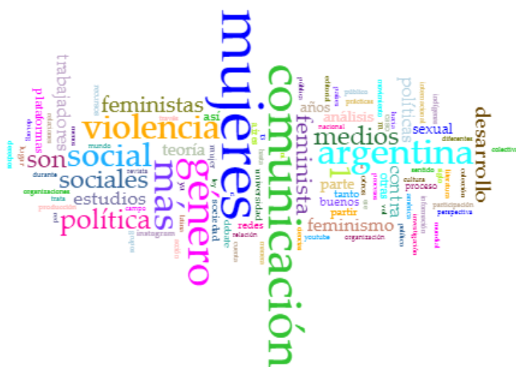
Figura 6. Resultados arrojados por la herramienta Cirrus para el corpus 2 ( teorías de la comunicación, mujer, Argentina ), Escala de términos 100.

Si se emplea la herramienta Colocaciones para identificar el contexto de las palabras más frecuentes, se observa que, por ejemplo, comunicación tiene como contexto: medios, desarrollo, social, perspectivas, género, estudios . El contexto del término mujer : violencia, contra, indígena, hacia, niñas .