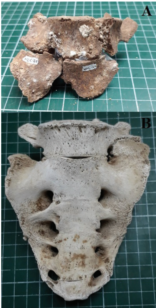
Fig. 3. A. Vista anterior de fragmento de sacro con presencia de sacralización incompleta unilateral derecha de L5 del individuo del sitio Hornos de Cal. 3. B. Vista anterior del sacro con sacralización incompleta de L5 unilateral izquierda del individuo del sitio CEFA-1

de enfermedades vertebrales degenerativas en el caso del individuo recuperado en CEFA-1, son similares con otras observadas en individuos de la costa de Antofagasta (Andrade et al. , 2014; Berrios, 2014), por lo que su manifestación puede deberse a que el individuo continuó realizando las labores comunes de su grupo social a pesar de la presencia de sacralización de L5.